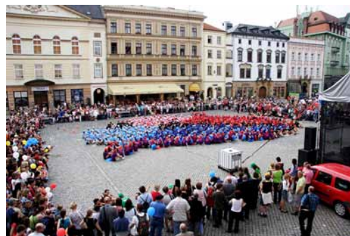
Loňská „největší hodina interaktivní biologie pod širým nebem“ na olomouckém Horním náměstí

Ve spolupráci s Pedagogickou fakultou UP připravuje nyní projektový tým materiály pro didaktický průzkum, který by měl být ještě před koncem školního realizovat na zúčastněných středních školách (Střední zdravotnická škola, Gymnázium Olomouc–Hejčín, Slovanské gymnázium Olomouc a Gymnázium Čajkovského). Průzkum chce srovnat, jaké mají znalosti v oblasti činnosti srdce studenti, kteří se do projektu zapojili, a ti, kteří se ho