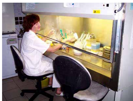
K pracovištím, které se na projektu podílejí, patří také Laboratoř experimentální medicíny LF UP (pracoviště tkáňových struktur)